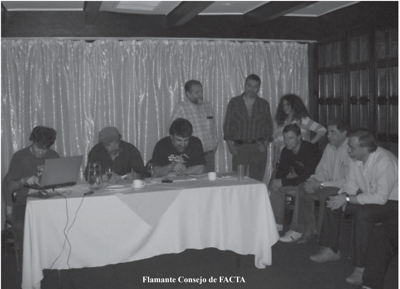
Flamante Consejo de FACTA

niendo en simultáneo desde Buenos Aires, Mendoza y Jujuy. También podremos informar sobre los nuevos proyectos en danza, como la comisión de Comercio Exterior que estamos encarando para que FACTA se transforme -en un corto plazo- en proveedora de insumos, materia prima y productos de valor agregado para países como la hermana república de Venezuela. País que nos solicita y muestra el interés de comprar vía FACTA productos de las empresas recuperadas y de la Economía Social. Todos estarán al tanto de los avances de la Red del Sur, programa de COSPE con la Financiación de la Unión Europea, de la cual FACTA participa como miembro ejecutor de los fondos por Argentina. En este proyecto, se trabajará con las Federaciones hermanas del MERCOSUR, como