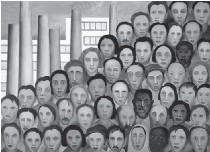
Tarsila do Amaral, pintora brasileña

C reemos que dimos un paso crucial en la organización de FACTA. La conformación del nuevo Consejo de Administración, tanto por su carácter federal y su ligazón con cada una de las filiales del país, es para nosotros el resultado de la maduración política y orgánica que supimos conseguir desde aquel 9 de diciembre de 2006,